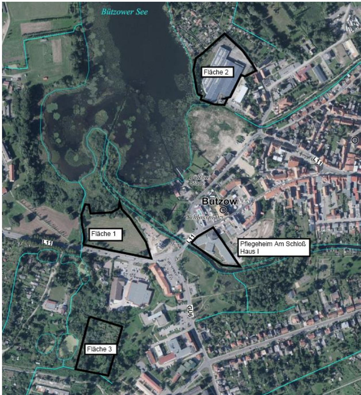
Abb. 3 – Standortuntersuchungen