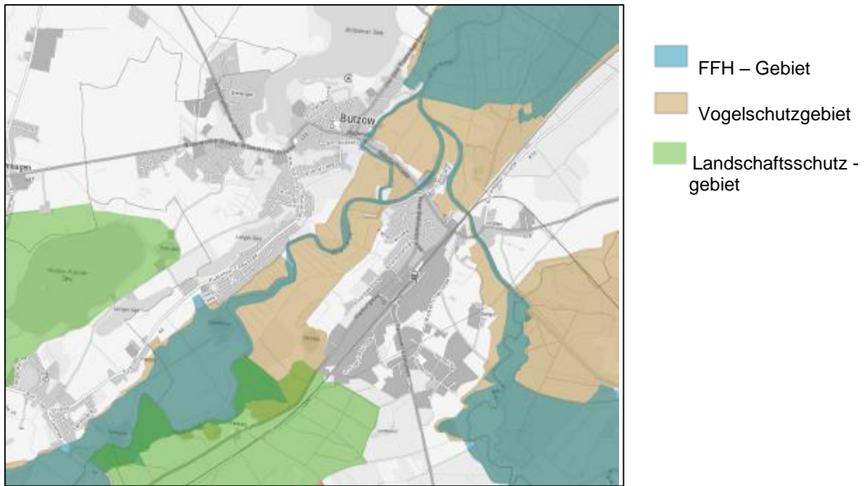
Abbildung 1: Schutzgebiete